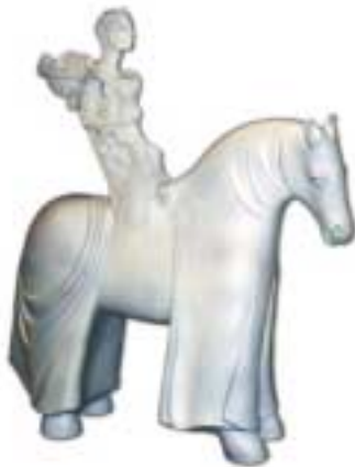
Cavallo con figura - ceramica, terracotta - cm 37x42x12