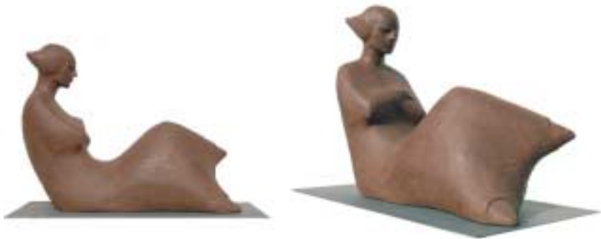
Uomo che produce silenzio - ceramica, terracotta - cm 45x20x34