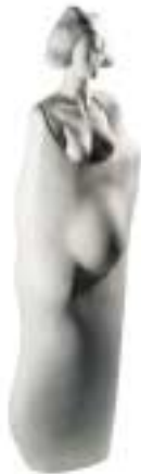
Il sogno - ceramica, terracotta - cm 20x16x74