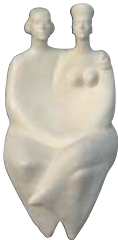
Re e Regina - ceramica, terracotta - cm 25x25x54