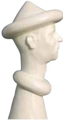
Made in China - ceramica, terracotta - cm 14x14x64