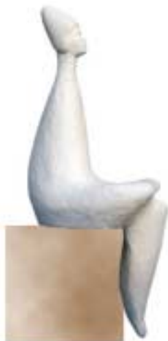
Maja - ceramica, terracotta - cm 30x26x67