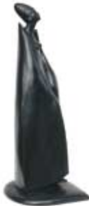
Semiramide - ceramica, terracotta - cm 25x25x67