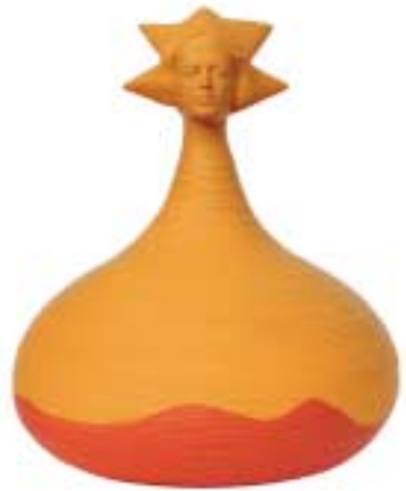
Mediterranea - ceramica, terracotta - cm 31x31x38