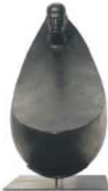
Tao - ceramica, terracotta - cm 70x19x22